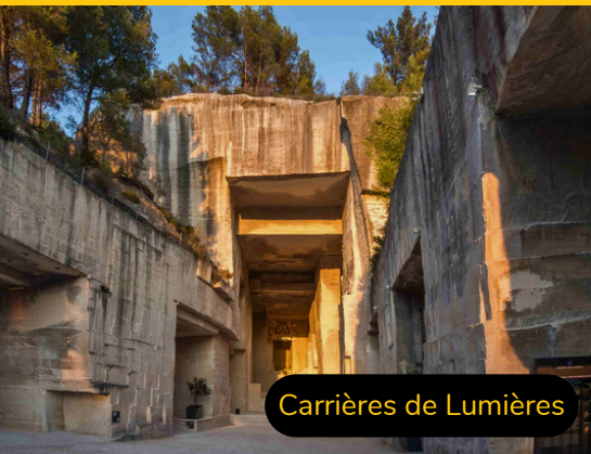
Carrières de Lumières