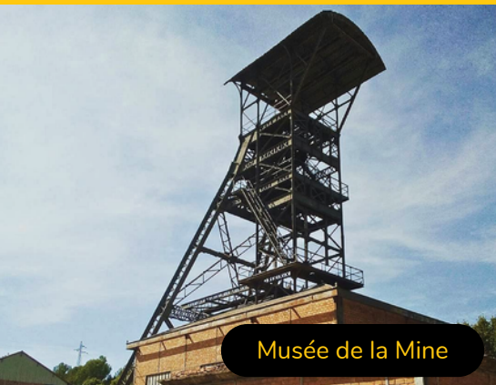
Musée de la Mine