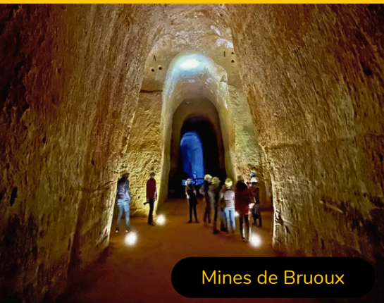
Mines de Bruoux